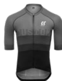
DRESY S KRÁTKÝM RUKÁVEM 5-9