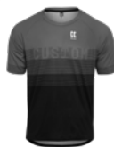
DRESY S KRÁTKÝM RUKÁVEM 13-14