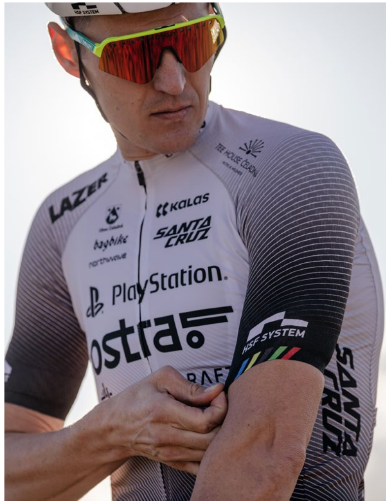
DRESY S KRÁTKÝM RUKÁVEM

Dres s krátkým rukávem je našim nejprodávanějším produktem. V každé z našich kolekcí si můžete vybrat z několika variant z mnoha střihů a látek. Z těchto různých produktů jistě najdete ten ideální, který bude splňovat vaše požadavky.