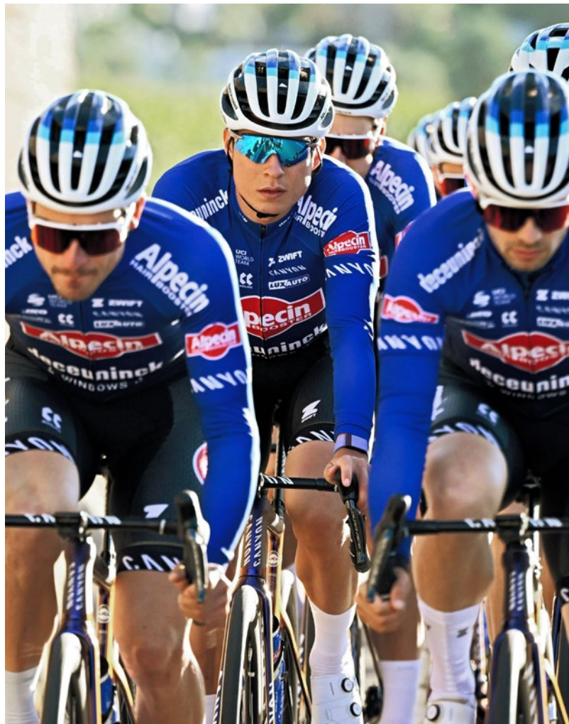
DRESY S DLOUHÝM RUKÁVEM

Přiléhavé dresy z našich kolekcí PRO a ELITE jsou vyrobeny ze zateplených a elastických materiálů s jemným počesáním na vnitřní straně pro větší teplo a pohodlí. V sekci OFF-ROAD najdete varianty pro jízdu na BMX, MTB a zpevněných cestách.